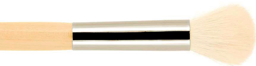
16H-8120 коза goat