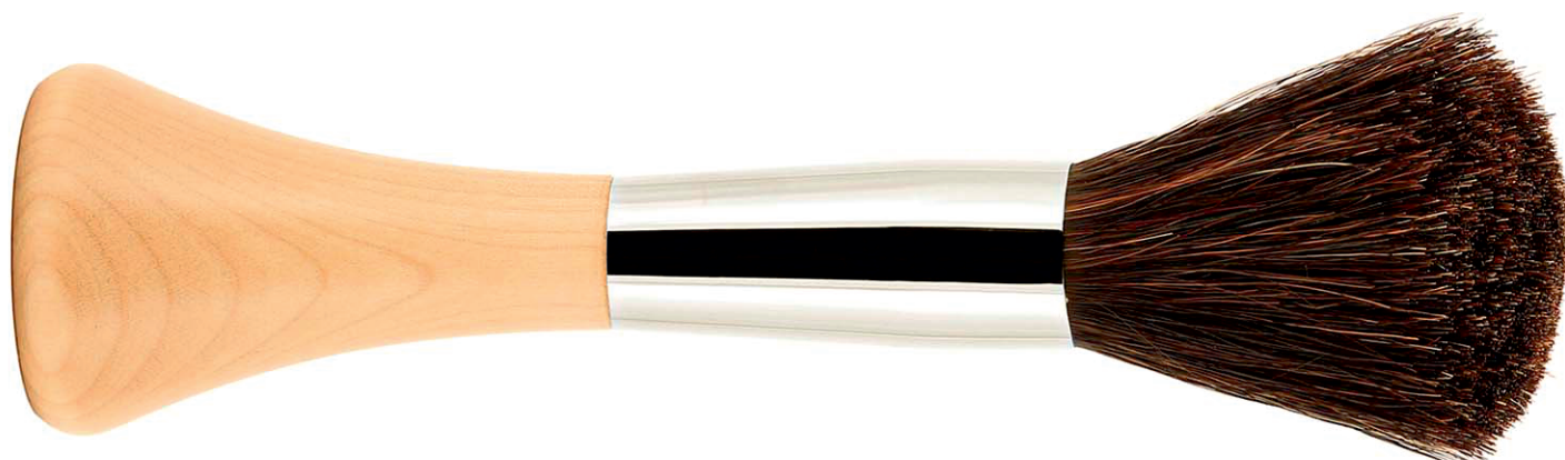
28H-512C буйвол buffalo