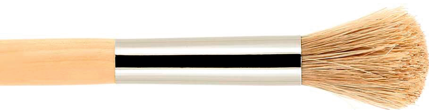
18H-5120 буйвол buffalo