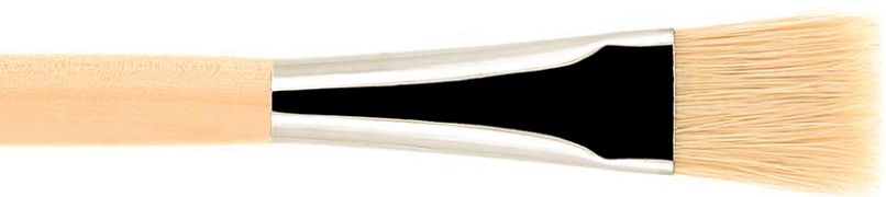
16H-4210 щетина bristle